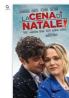
La cena di Natale Commedia