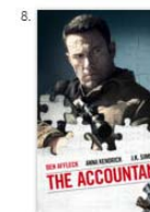
The Accountant Drammatico