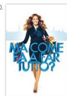
Ma come fa a far Commedia