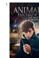
Animali Fantastici Azione e avventura