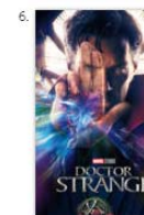
Doctor Strange Azione e avventura