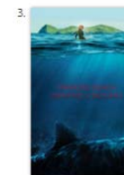
Paradise Beach Thriller